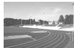
<< Schleswig-Holsteinisches Landestheater < Eiderstadion