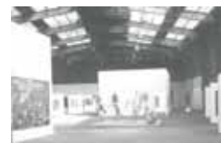
<< Yachthafen an der Obereider < Kunst in der Carlshütte