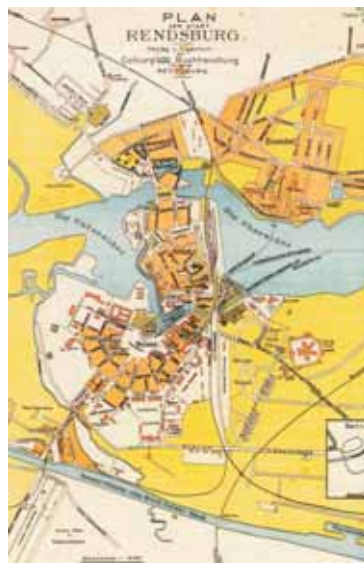
Rendsburg und Büdelsdorf 1914 (Quelle: Edward Hoop: "Wenn Steine reden...")