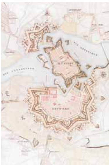
Rendsburg und Büdelsdorf 1840